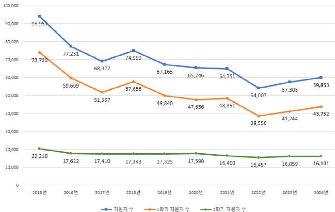
[그림 1] 2015-2024학년도 방송대 신·편입 지원자 규모