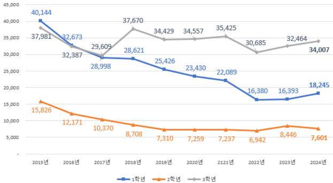
[그림 3] 2015-2024 신·편입 학년별 지원자 수의 추이