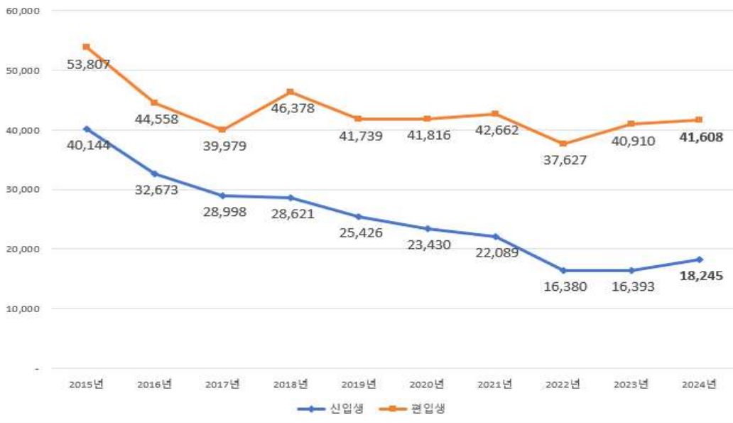
[그림 2] 2015-2024 신입 및 편입 지원자 수의 추이