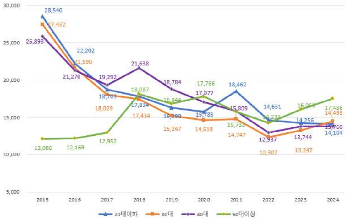
[그림 6] 2015-2024 연령대별 지원자 수의 추이