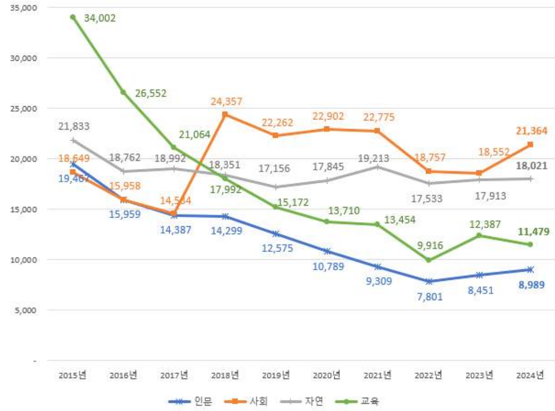
[그림 4] 2015-2024 단과대학별 지원자 수의 추이